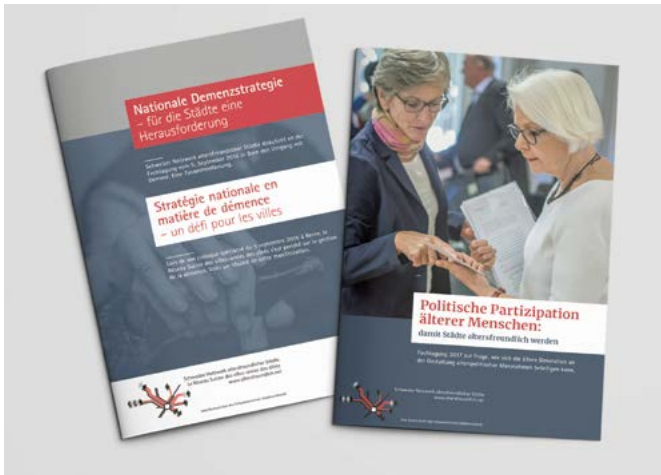
Abb. 1: Booklets können bestellt werden bei: strategien@ritagisler.ch

Der Austausch untereinander ist ein großer Mehrwert des Netzwerks, denn es ist die einzige Plattform für die verantwortlichen Behörden- und Verwaltungsvertretungen, um unter Gleichgesinnten qualifiziert über Gestaltung und Umsetzung von Alterspolitik zu diskutieren. Die Notwendigkeit für ein solches Gefäß kam auch in einer im Jahr 2014 vom Schweizerischen Städteverband in Auftrag gegebenen Studie zur Alterspolitik in Schweizer Städten (Ecoplan 2014) zum Ausdruck. Eine große Zahl der 69 teilnehmenden Städte wünschte ein solches Gefäß.